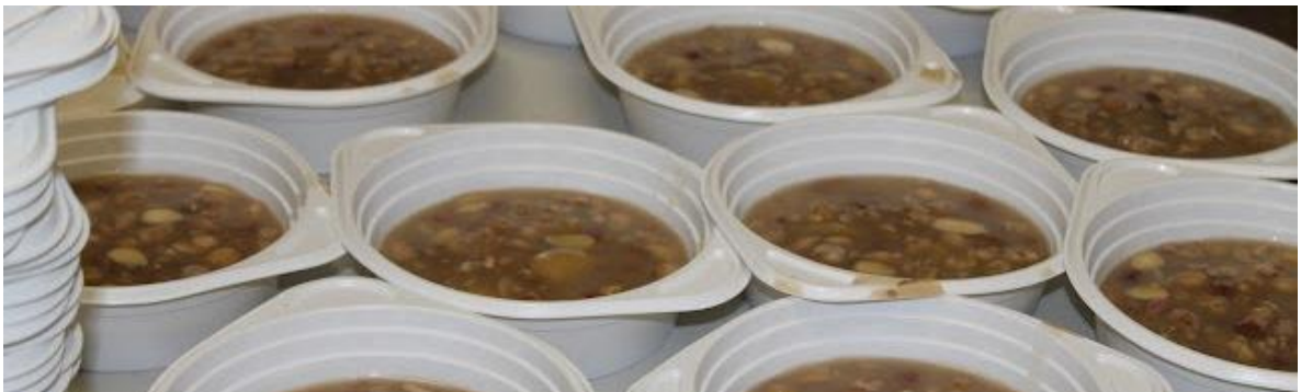
Matem'in On üçüncü günü en az 1000 kişinin katılımıyla Kurban Lokması ve Aşure birlikte yenildi.