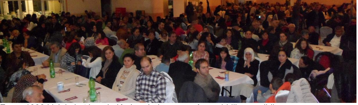
En az 1000 kişinin katılımıyla Kurban Lokması ve Aşure birlikte yenildi.