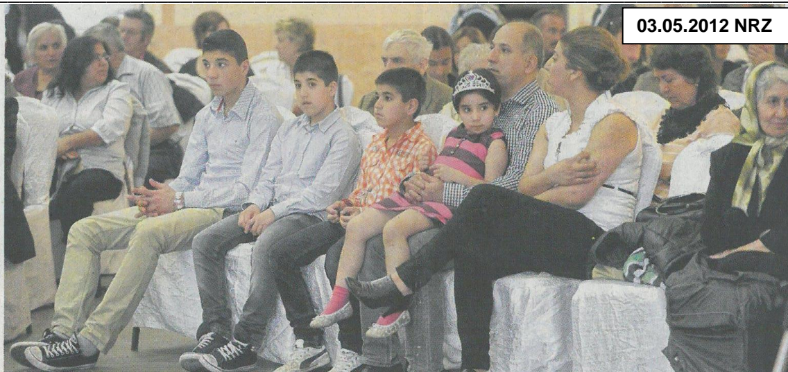
Viele junge Besucher kamen zum Maifest der Alevitischen Gemeinde in Rheinhausen.