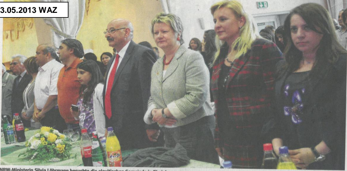
NRW-Ministerin Sylvia Löhrmann besuchte die alevitischen Gemeinde in Rheinhausen.