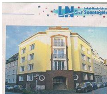
Hier im Gebäude Berta-/Dorotheenstraße in Hochemmerich fing mit dem Alevi-Bektasi Kultur e. V. alles an.