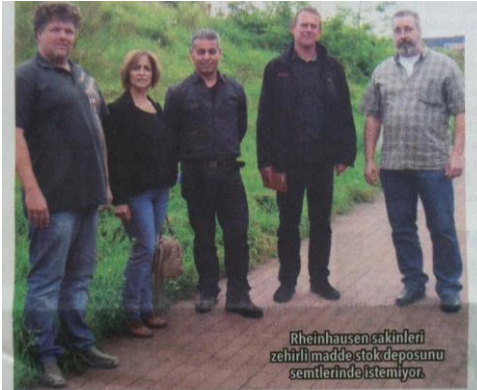
Rheinhausen sakinleri zehirli madde stok deposunu semtlerinde istemiyor.