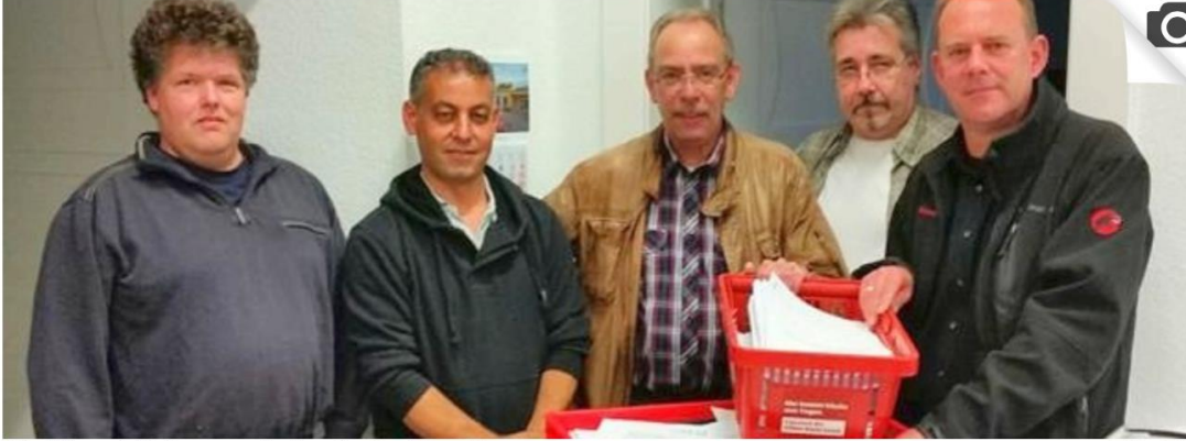
Die Bürgerinitiative, am Freitag im Bezirksrathaus.